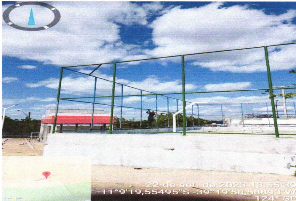
Foto 14- PINTURA E EXECUÇÃO DO ALAMBRADO