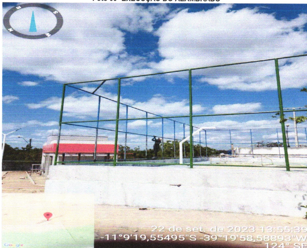
Foto 10- EXECUÇÃO DOS POSTES E ALAMBRADO